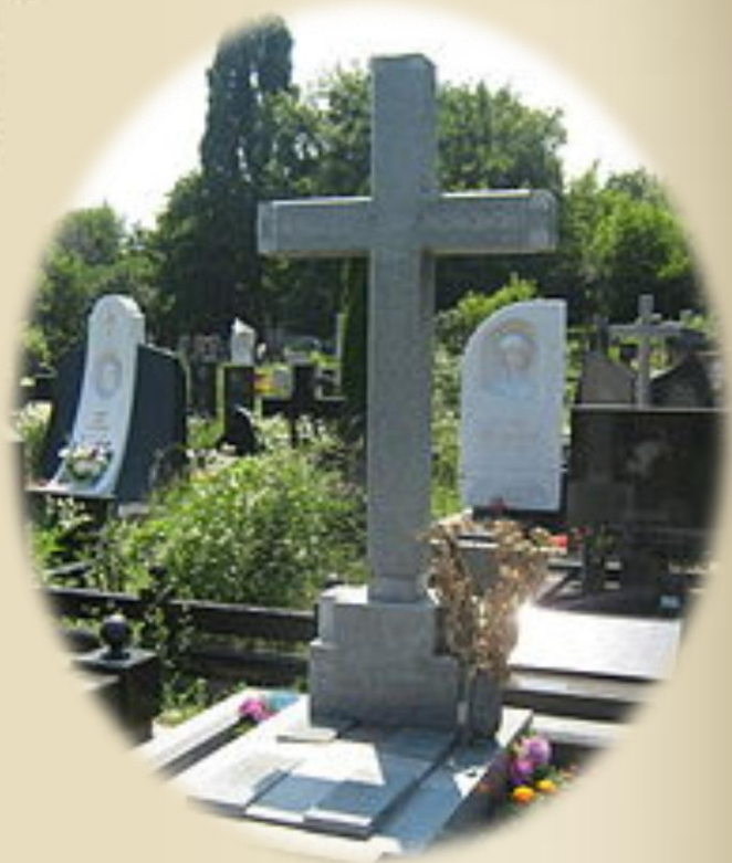
Могила Миколи Вінграновського